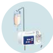
Nutrición Enteral Domiciliaria