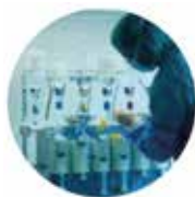
Nutrición Parenteral Domiciliaria