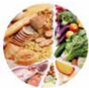
Desnutrición relacionada con la enfermedad

Ponemos a su disposición 5 Módulos que incluyen 4 secciones cada uno, en las que se revisarán los aspectos más importantes de varias enfermedades, qué es lo que debe conocer el paciente y el cuidador y cómo puede mejorar la adhesión al tratamiento prescrito y su calidad de vida.